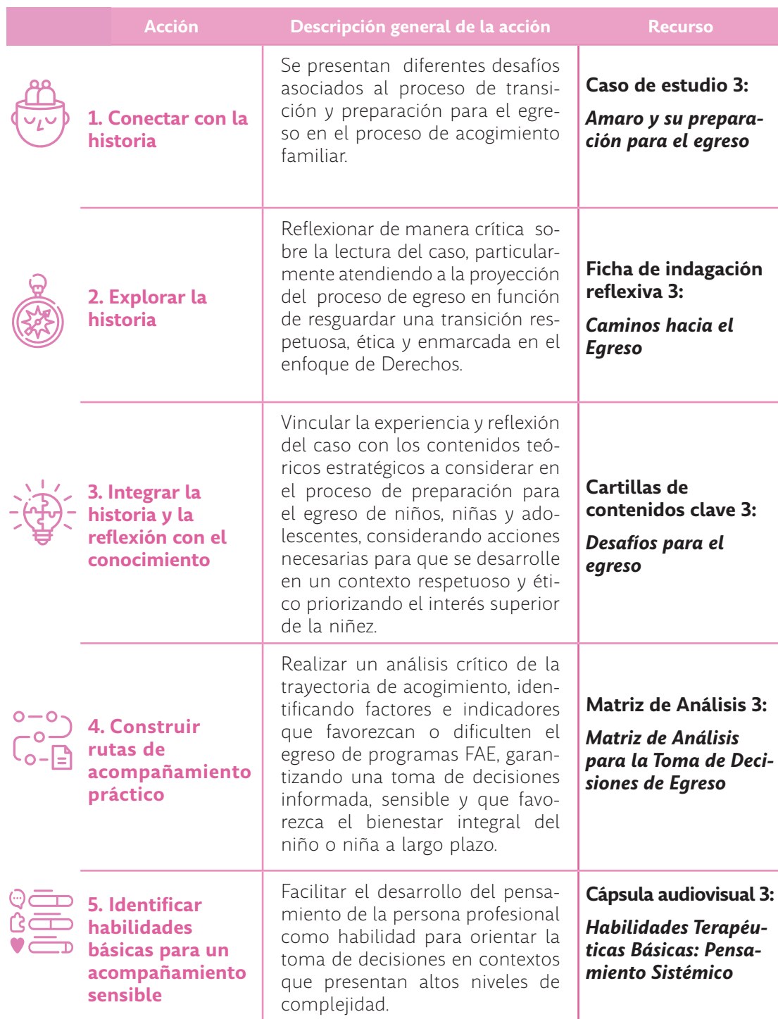
TABLA 7. RUTA DE ANÁLISIS MÓDULO 3.