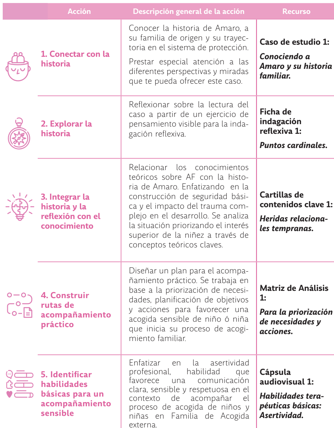
TABLA 3. RUTA DE ANÁLISIS MÓDULO 1.