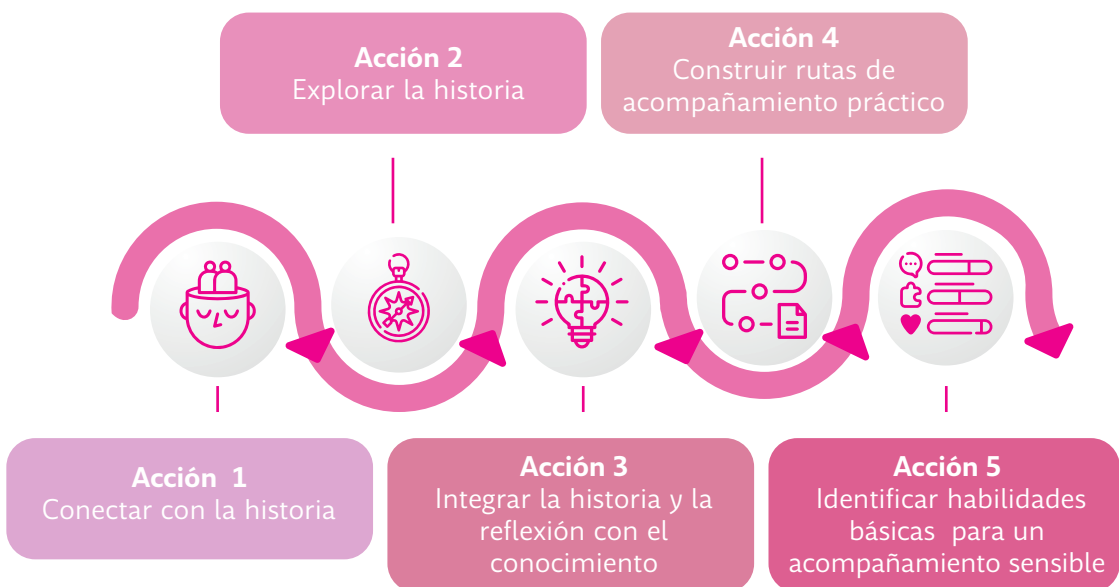
FIGURA 3. RUTA DE ANÁLISIS PROGRAMA APRENDER PARA ACOGER

Conocer la Ruta de Análisis , un recorrido de 5 acciones que sirven de guía para realizar el módulo 1, módulo 2 y módulo 3 del programa Aprender para Acoger.