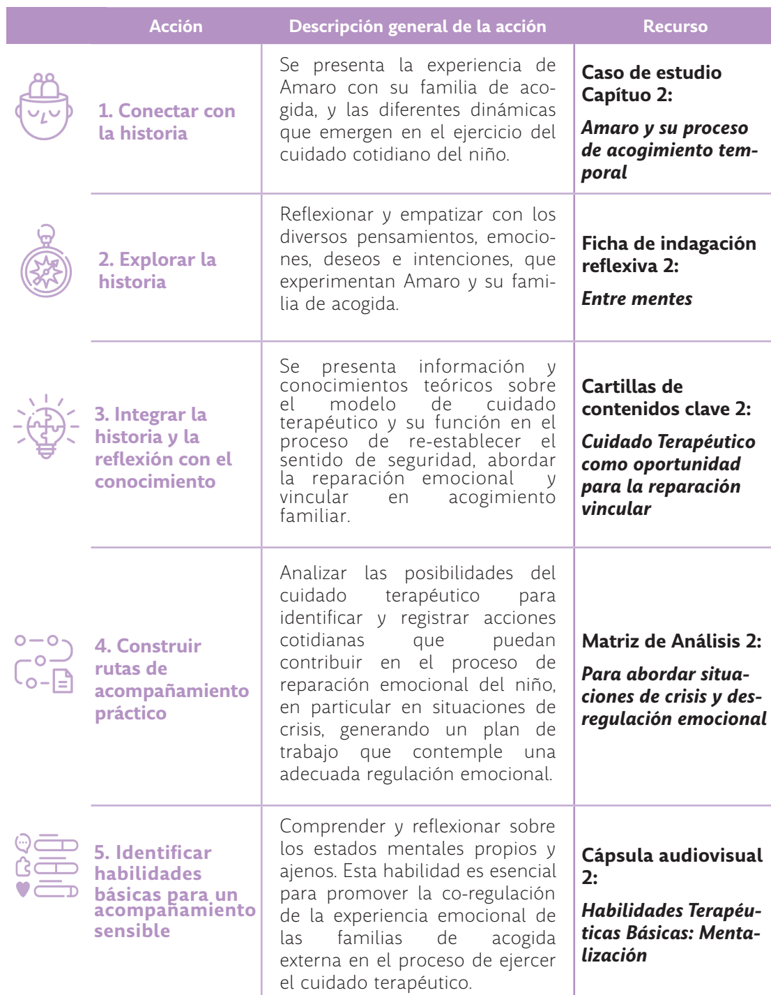
TABLA 5. RUTA DE ANÁLISIS DEL MÓDULO 2